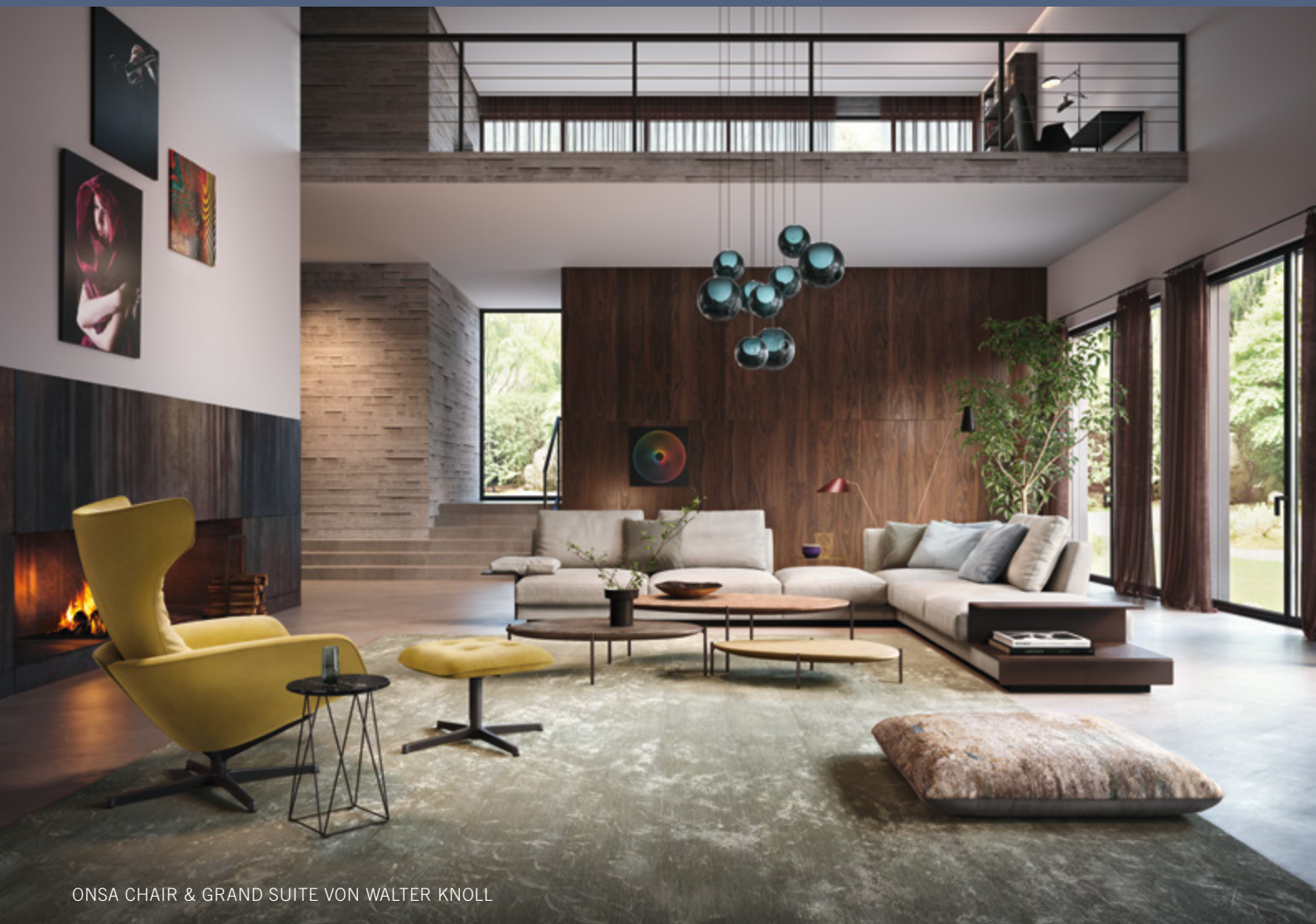
ONSA CHAIR & GRAND SUITE VON WALTER KNOLL

Ausgabe 01/2018 6. Jahrgang Schutzgebühr 9,- €